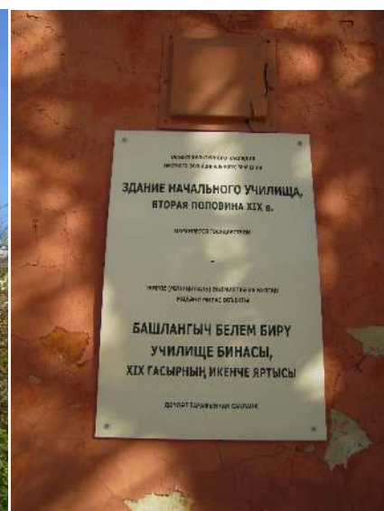
Мемориальная табличка на стене здания