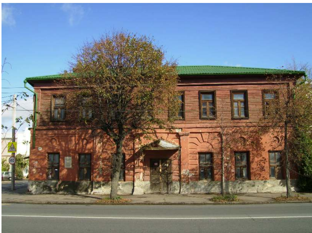
Здание бывшего Третьего городского начального училища (современный адрес: ул. Гладилова, 26)

После победы Октября начальное училище в Ягодной слободе было закрыто, а вклад его в народное просвещение края со временем забыт. В советское время здание было надстроено вторым деревянным этажом, какое-то время здесь располагался районный музей. Состояние, в котором сегодня пребывает здание одного из старейших в Казани учебных заведений, весьма плачевно.