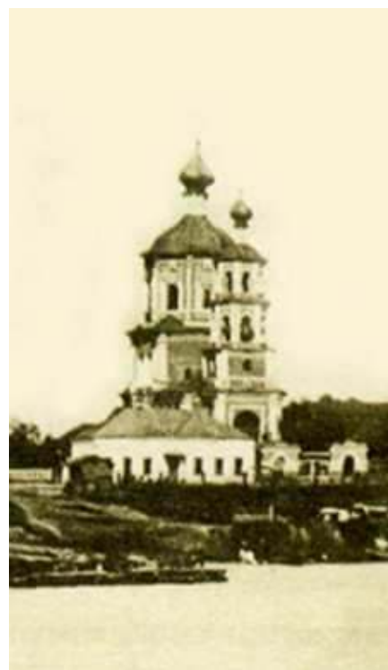
Смоленско-Дмитриевская церковь и училище (н. XX в.)