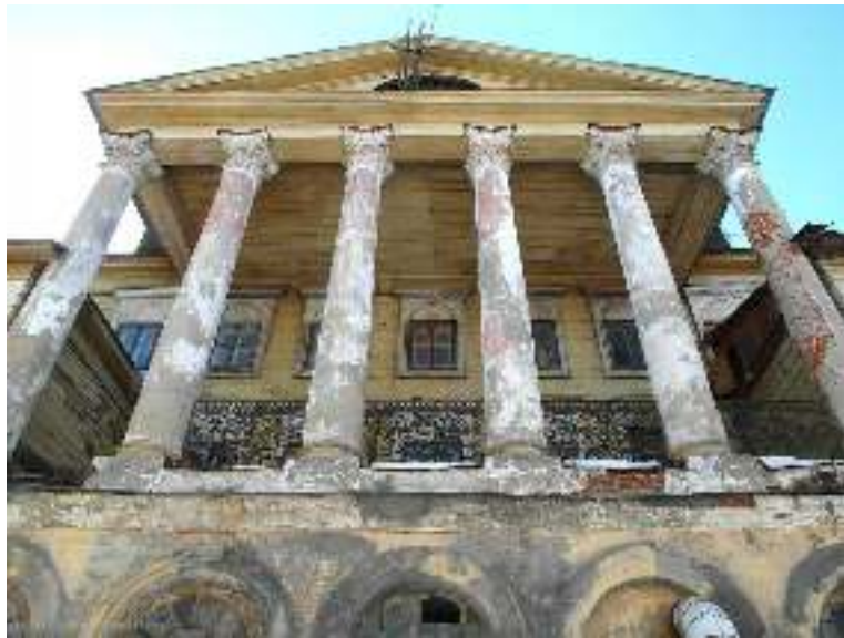
Дом Котелова, 1833 г., архитектор П.Г. Пятницкий (современный адрес: ул. Гладилова, 53)