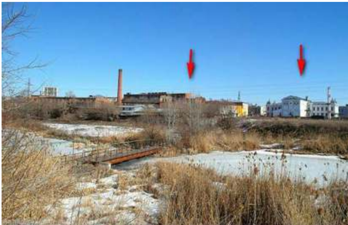
Сохранившиеся здания некогда единого производственного комплекса (вид со стороны Адмиралтейской слободы)