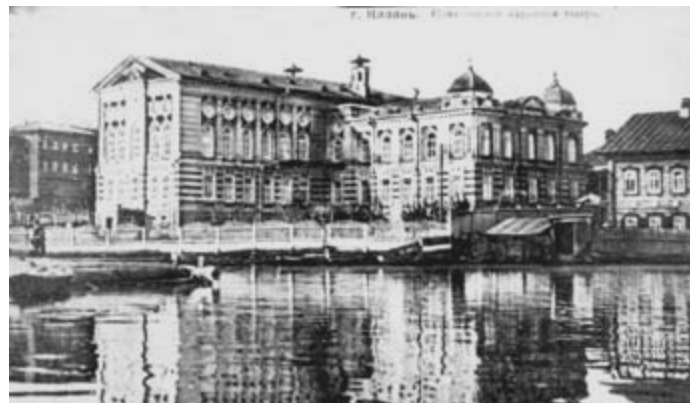
Здание образовательного дома имени Александра II: парадный фасад (слева) и тыльная сторона (справа)

В 1916 г. в состав Алафузовских фабрик и заводов входили только в Казани: «льнопрядильная, ткацкая и суконная фабрики; отделение по обработке ткани непромокаемыми составами; белильные и красильные отделения; шорно-амуниционные, военно-обмундировальные мастерские; кожевенные заводы (подошвенный, юфтовый с отделявательными и раскройными мастерскими; сыромятный); клееваренный завод; мастерские конной упряжи; мастерские