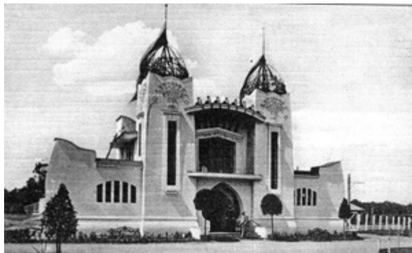
Павильон Алафузовых на выставке 1909 года в Казани

С 1892 по 1916 г. капитал 30 промышленных заведений «АФУЗО» вырос с 4 до 14 миллионов рублей, а портфель процентных бумаг – с 400 тысяч до 1,5 миллионов рублей. В 1917 г. на алафузовских предприятиях было занято в общей сложности 10125 рабочих, а в отдельные периоды в связи с получением срочных военных заказов численность их достигла 16 тысяч человек. К началу XX века, заняв ведущее место в системе европейских торговцев кожей и текстилем, Алафузовы перешагнули океан, открыв свой магазин в Нью-Йорке (1907 г.).