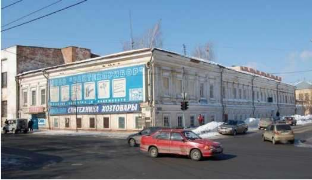
Дом И.И. Алафузова, 1815 г. (современный адрес: ул. Клары Цеткин, 18/20. Подлежит сносу)