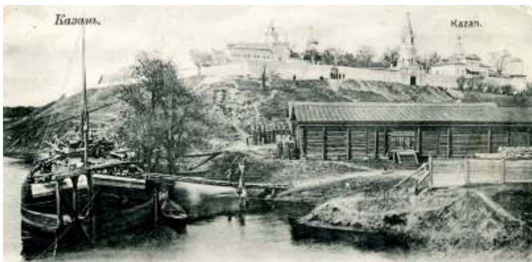
Успенский Зилантов монастырь (открытка н. XX века)