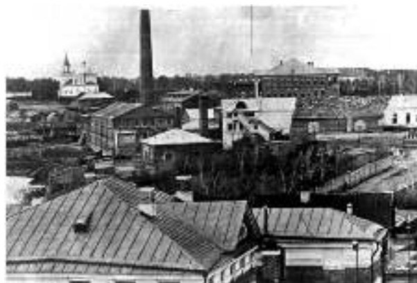
Вид на заводские корпуса сверху

В 1896 году в Казани было построено новое каменное здание льнопрядильной фабрики «по последним требованиям техники и гигиены», и ежегодная производительность возросла до 18 тысяч пудов пряжи. Ткацкое отделение помещалось в двух каменных трёхэтажных корпусах, где выпускались