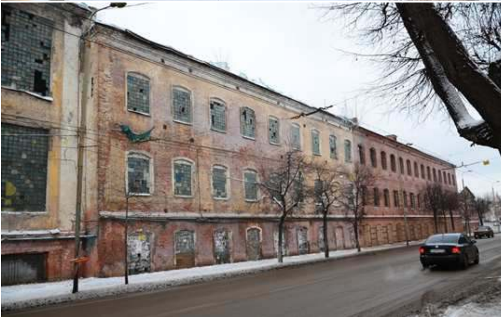
Производственные корпуса льнокомбината (современный адрес: ул. Гладилова, дома 51 – 55)