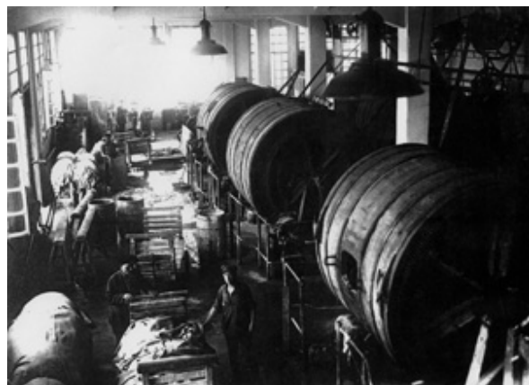
Цех (к. XIX века)