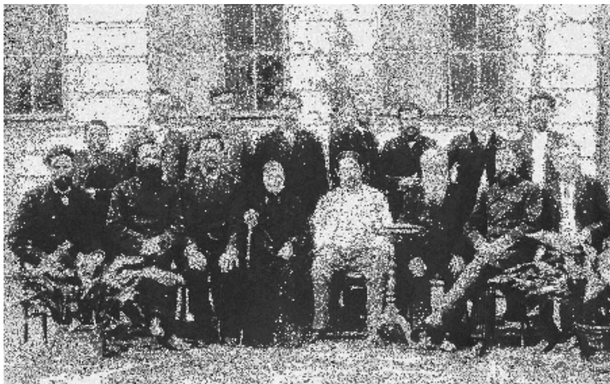
И.И. Алафузов (в светлом пиджаке) среди родственников и сотрудников предприятия (к. XIX века)

Иван Иванович был известен и как благотворитель. В 1868 году он выделил 4000 рублей для оказания помощи голодающим в северных губерниях, в 1874 году – 3200 рублей на учреждение трёх стипендий имени Людмилы Алафузовой в Мариинской женской гимназии Казани, в 1882 году внес 3000 рублей на постройку в столице здания женской рукодельной школы императрицы Марии Александровны, в 1883 году учредил шесть стипендий в Ложкинской богадельне Казани, внося в банк 7000 рублей; жертвовал пособия для рабочих при богадельне Казанского человеколюбивого общества (1883), на строительство церквей и т.д.