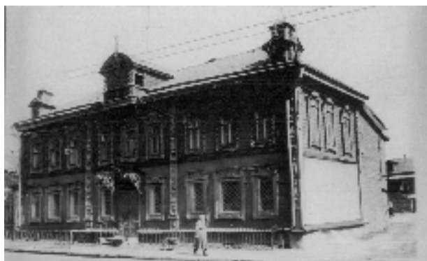
Дом Алафузовых на Архангельской улице в Ягодной слободе

по «высочайшему разрешению», изменив волю И.И. Алафузова, 200 тысяч присоединили к капиталу, выделенному на возведение зданий новой университетской клиники на Арском поле.