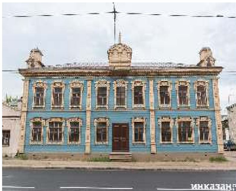
Дом И.И. Алафузова, вторая половина XIX века (современный адрес: ул. Гладилова, 46)