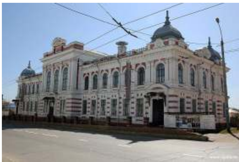
Алафузовский театр, 1900 г., архитектор Л.К. Хрщонович (современный адрес: ул. Гладилова, 49)